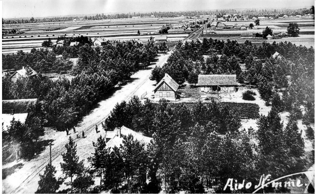
Vaade Aidu-Nõmme külale 1938.a