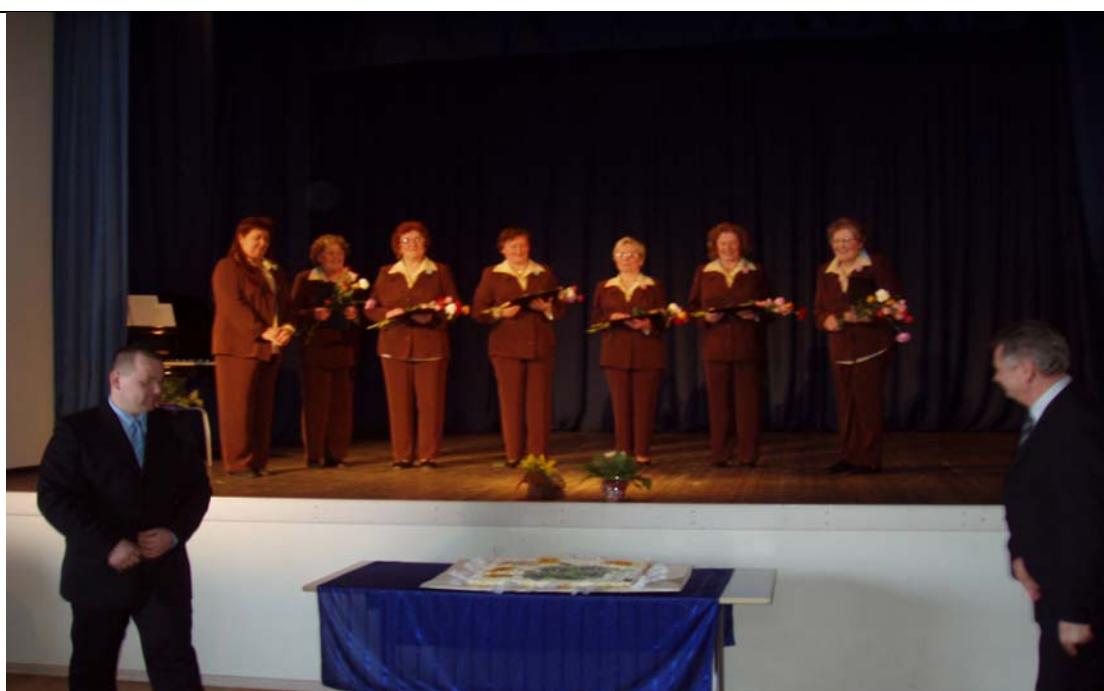
12. märtsil pidas naisansambel "RUKKILILL" oma 20. sünnipäeva